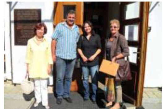
Direktorenwechsel bei der VS

Mit dem Kauf eines gebrauchten Schulbusses können ein Teil unserer Volksschul- und Kindergartenkinder weiterhin täglich von der Gemeinde transportiert werden.