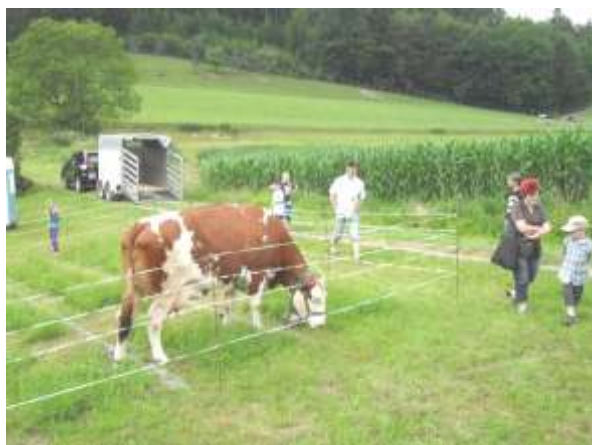
Kuhlotto beim Saugrillen