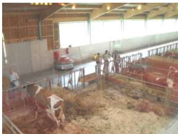
Bauernbundausflug „Kuhcafé“ Derler