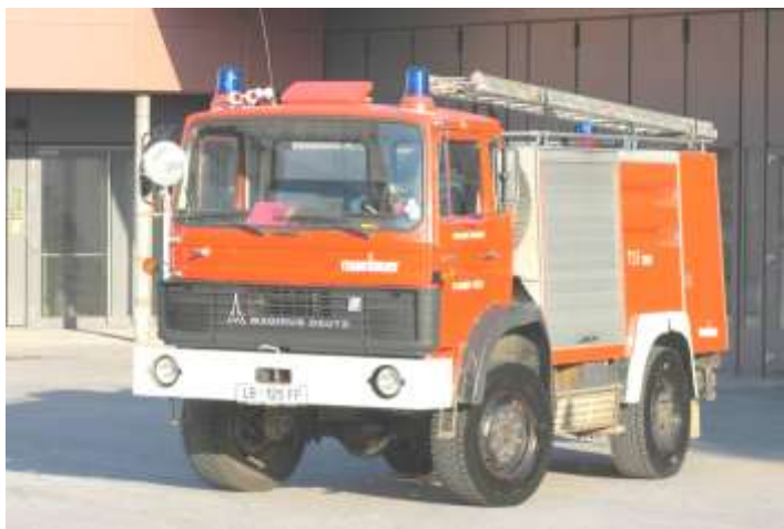
Tanklöschfahrzeug TLF-A 2000 Bj. 1980