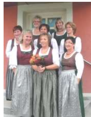
Der neu gewählte Vorstand

Wir wünschen allen ein frohes Weihnachtsfest und ein gutes und vor allem gesundes Jahr 2012 und freuen uns wieder auf viele schöne, gemeinsame Stunden. Der Vorstand